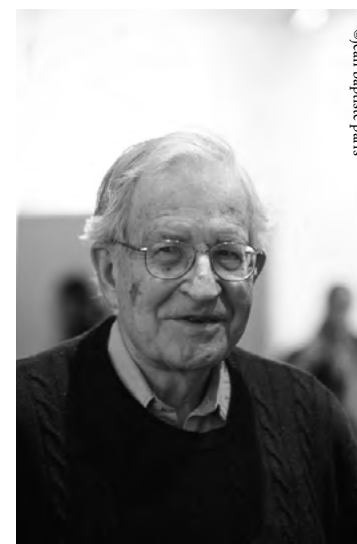
@jean baptiste paris

Noam Chomsky es profesor emérito de Lingüística en el Instituto Tecnológico de Massachusetts (MIT), una de las figuras más importantes para la disciplina en el siglo xx y un anarquista o socialista libertario, según sus propias palabras. El New York Times lo catalogó como «el más importante de los intelectuales vivos».